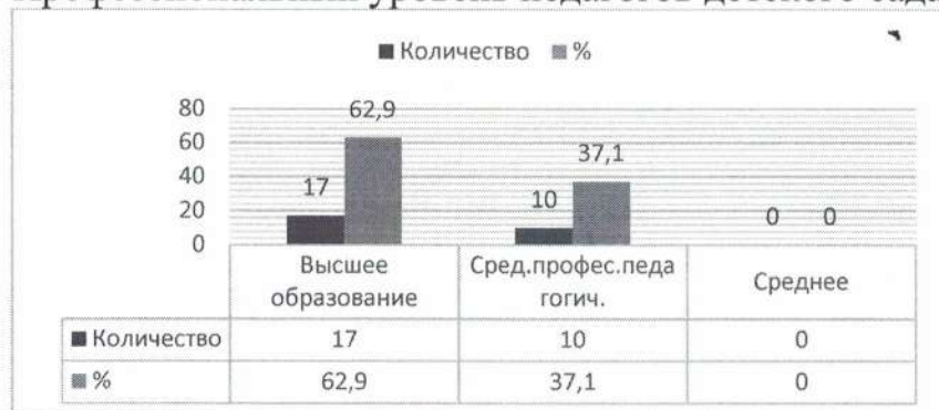
Диаграмма с характеристиками кадрового состава детского сада Профессиональный уровень педагогов детского сада: