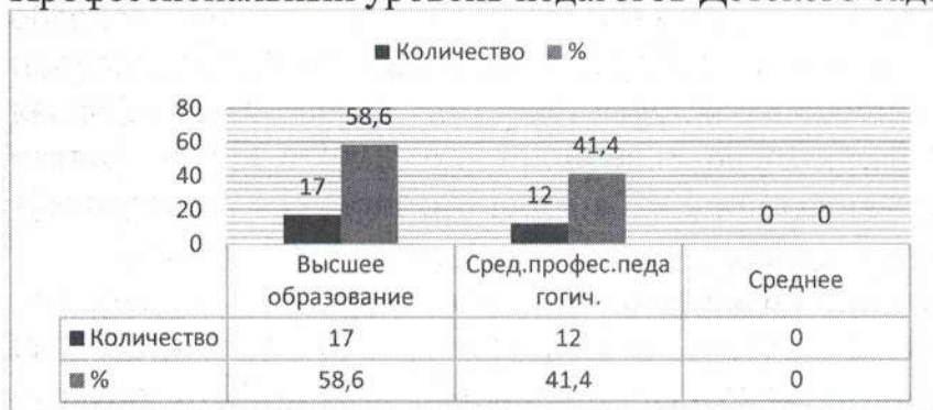
Диаграмма с характеристиками кадрового состава Детского сада Профессиональный уровень педагогов Детского сада:

Одним из актуальных направлений работы по внутрифирменному повышению квалификации является работа по самообразованию педагогов. Разработаны персонифицированные программы повышения квалификации педагогов. С целью повышения качества самообразования организована работа по созданию электронного портфолио педагогов как формы оценки его профессионализма и результативности работы. В ДОУ разрабатываются методические рекомендации для педагогов по оформлению электронного портфолио, организована работа по обмену опытом через показ открытых форм работы с детьми, методические часы, семинары, мастер-классы.