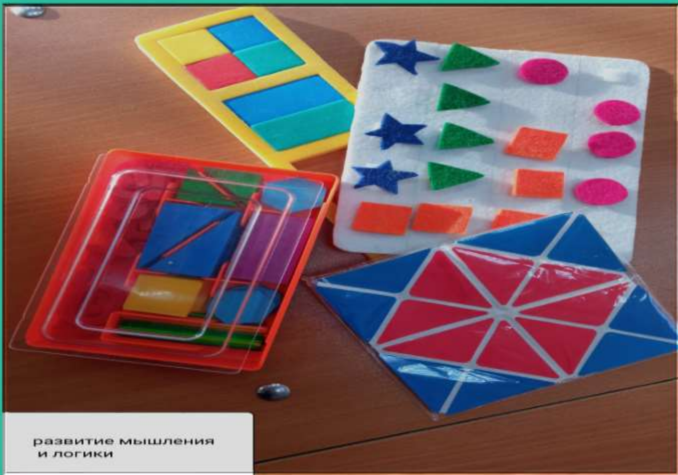
развитие мышления и логики