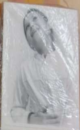
РАЗВИТИЕ ВИЗУАЛЬНОЙ ВЫРАЗИТЕЛЬНОСТИ